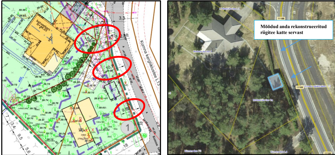
Joonis 2. Väljavõtte planeeringu põhijoonisest ja Maa-ameti kaardirakendusest